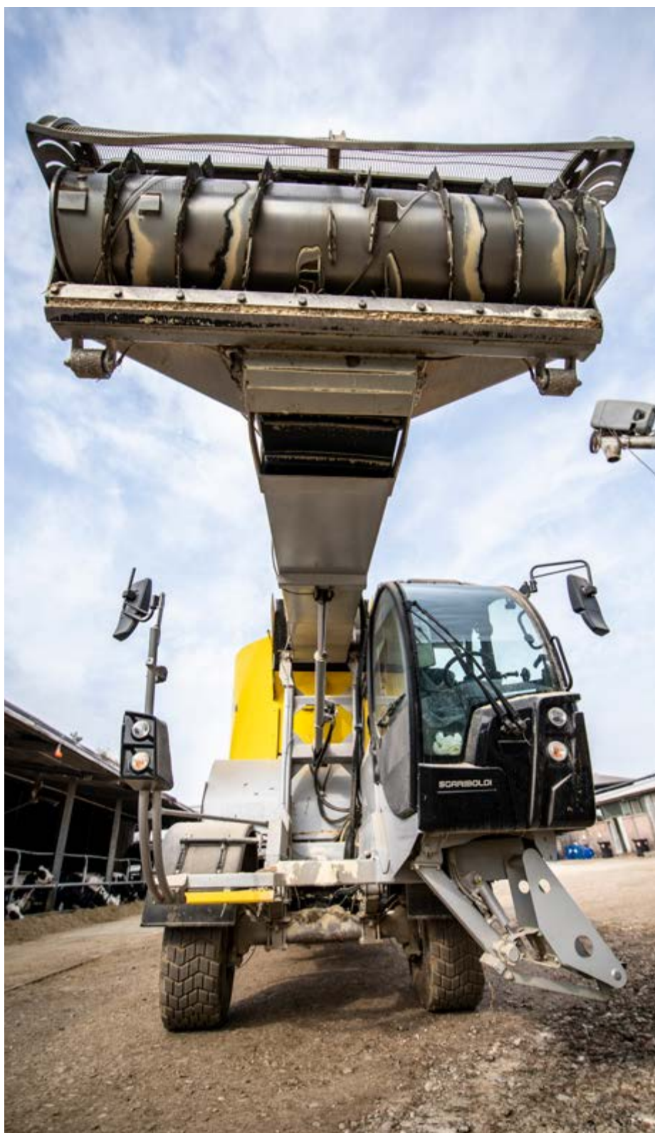
Una visione frontale del carro miscelatore semovente Grizzly 8130 S della Sgariboldi, in uso all'azienda agricola Gomiero, di Limena (Pd). In evidenza la grande fresa, che può alzarsi sino a 5,8 metri. E in basso a destra nella foto si nota l'autolift, ossia il gruppo di scalini mobili che garantisce un comodo ingresso in cabina