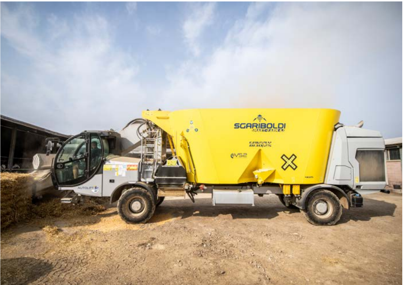
Il carro miscelatore adottato dall'azienda Gomiero, il Grizzly 8130 S della Sgariboldi, è dotato di I-Cab II, cabina di ultima generazione, e del sistema Intellitechnology

Schema della "tecnologia verticale VS2" adottata dai carri miscelatori verticali della Sgariboldi, basata sull'azione di coclee coniche verticali (due coclee nel caso del carro in uso all'azienda Gomiero). Queste, abbinata ai coltelli, ai controcoltelli e alla forma della vasca, garantiscono un taglio netto dei prodotti a fibra lunga