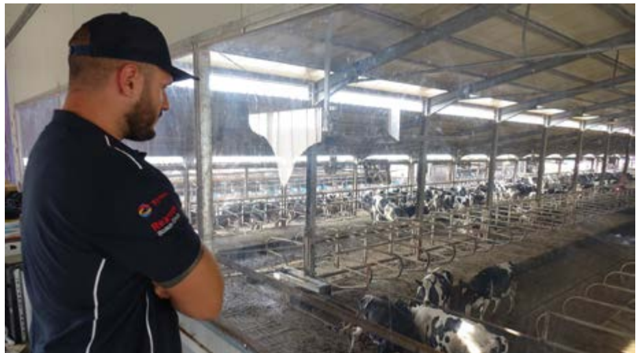
Ancora il giovane allevatore mentre controlla le proprie bovine. L'azienda agricola Gomiero si trova a Limena, in provincia di Padova; alleva 1.200 capi bovini, di cui circa la metà sono vacche in lattazione